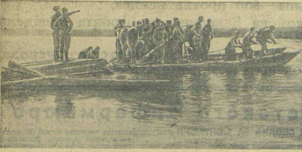
СЕВЕРНЕЕ КИЕВА. Бойцы Н-ской части переправляются через Днепр.